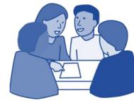
Te Whakahaere Ngaio