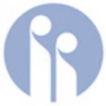
Te huanga o IWIinvestor